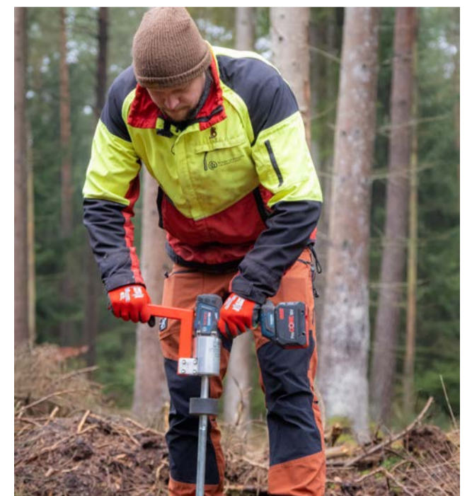
Innovative Pflanzverfahren wie der E-Planter sind zur Wiederaufforstung im Einsatz.

Eine Initiative von Antenne Niedersachsen, der Initiative fit4future natur der fit4future foundation Germany, dem Kindernetzwerk United Kids Foundations und den Niedersächsischen Landesforsten.