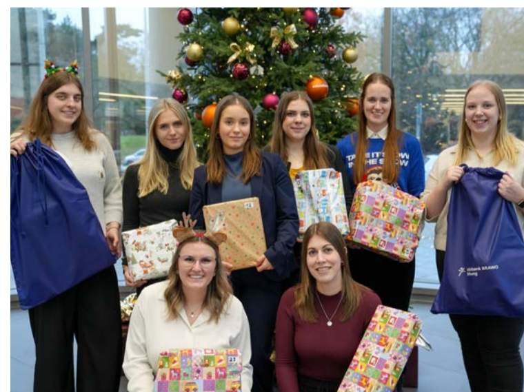
Fleißige Weihnachtsengel packten individuell zusammengestellte Geschenktüten für Kinder und Jugendliche.

Die Weihnachtsinitiative der Volksbank BRAWO Stiftung beschenkt in diesem Jahr 1.216 Kinder zu Heiligabend