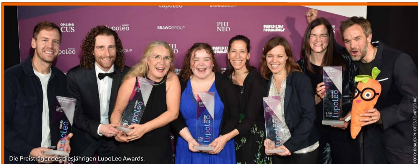
Die Preisträger des diesjährigen LupoLeo Awards.