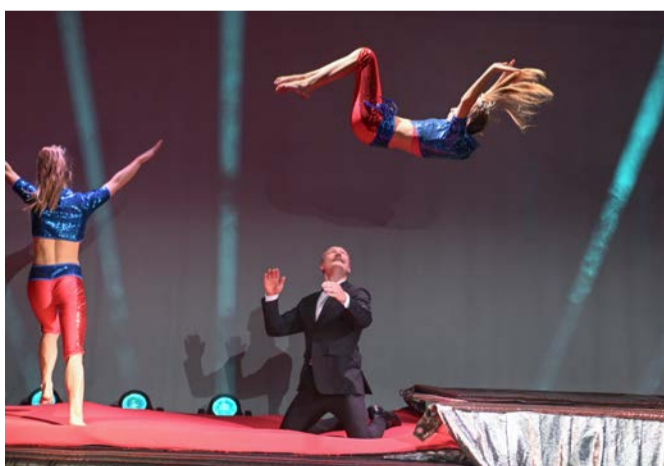
Die Flying Superkids aus Dänemark boten eine beeindruckende Show aus Akrobatik, Artistik und Turnen.