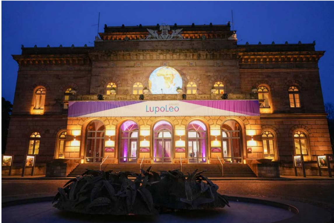
Das Staatstheater Braunschweig bot rund 600 Gästen ein feierliches Ambiente für die Gala.