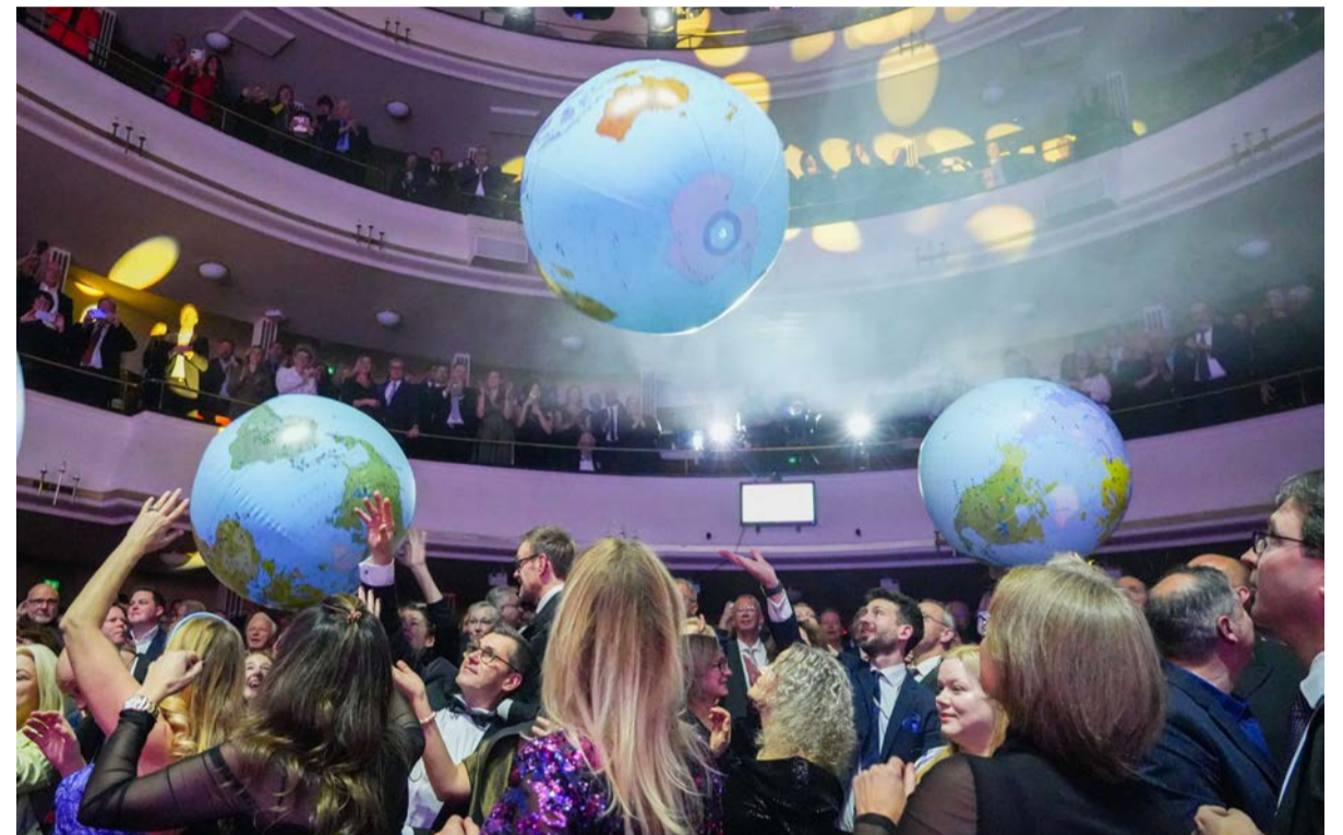
Die Besucher interpretierten das Motto der diesjährigen Awards mit aufblasbaren Weltkugeln.